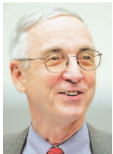
Gordon England

Fuentes del Departamento de Estado señalaron que el memorando es “una mera información” a los mandos militares estadounidenses de la decisión adoptada a finales del mes pasado por el Tribunal Supremo estadounidense.