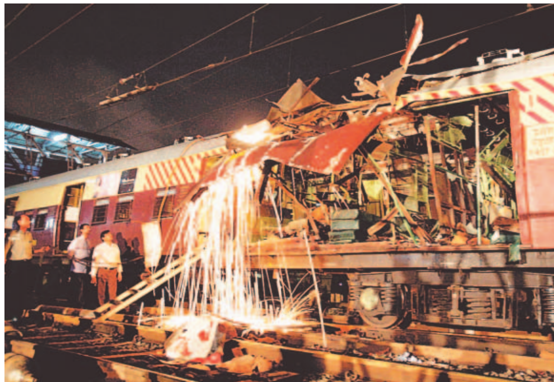
TERROR. Miles de personas cancelaron ayer sus boletos luego que se enteraron de las explosiones de las bombas en el sistema ferroviario.

■ Se sospecha de militantes musulmanes que se enfrentan al gobierno de Nueva Delhi en Cachemira.