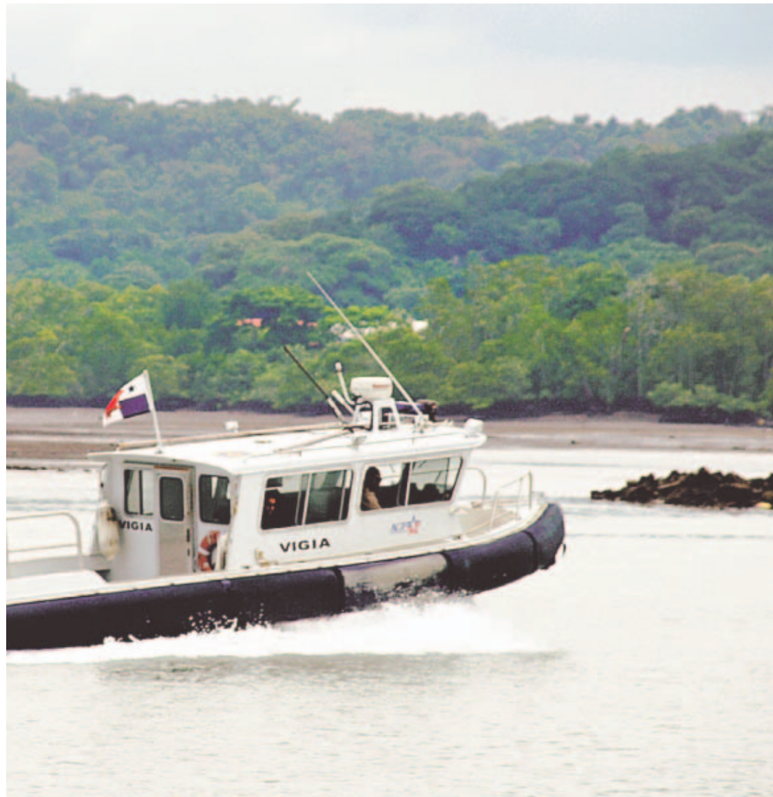
FONDO DE MAR. El área destinada a la terminal de contenedores es compartida por la Autoridad Marítima de Panamá y la Autoridad del Canal de Panamá.

“No se trata de favorecer a nadie”, comentó. Sin embargo, algunos analistas vinculados al sector consideran que con los cambios “cualquier individuo puede participar sin tener ninguna idea de cómo se opera