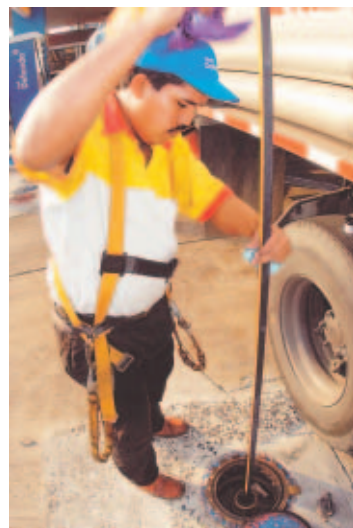
En el mercado local abunda el combustible venezolano.

De acuerdo con un informe que detalla el país de origen de los derivados de petróleo, elaborado por la Contraloría General de la República, en el