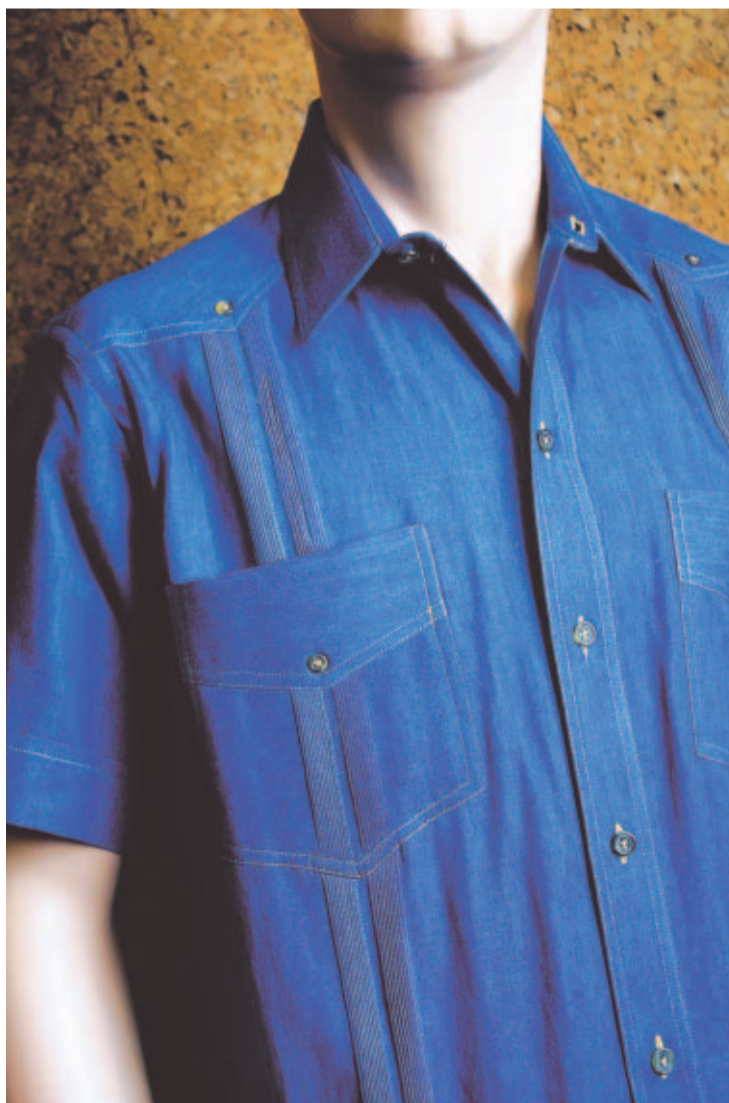
VARIACIONES. Corte tradicional pero en corduroy.

teorías sobre su origen y la autoría de los diseños.