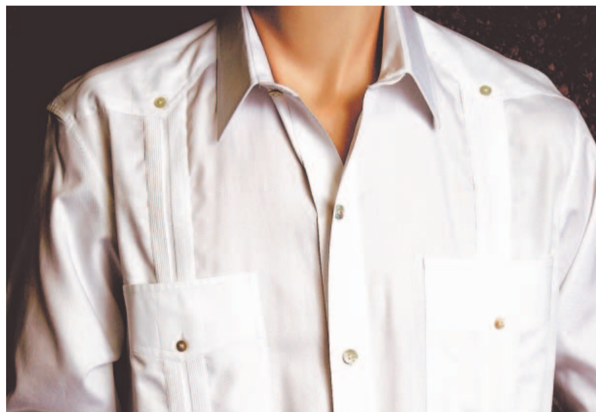
CLÁSICA. Blanca, con alforzas, cuatro bolsillos, botones, tres puntas atrás y dos adelante, aberturas y faja.