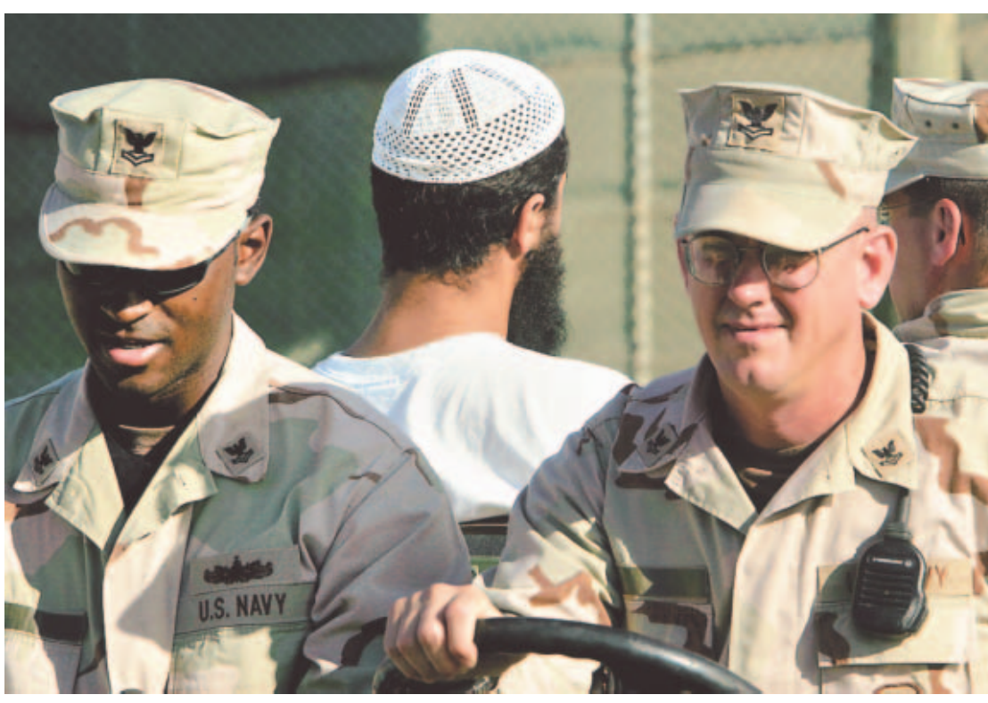
SOSPECHOSOS. Al menos 450 prisioneros extranjeros acusados de terrorismo están detenidos en la base situada en Cuba.