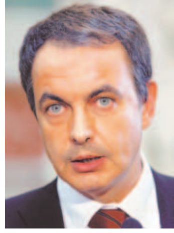
José Luis Rodríguez Zapatero

El presidente del Gobierno español, José Luis Rodríguez Zapatero, anunció ayer el inicio del diálogo con ETA, en un proceso que no tendrá el apoyo del conservador Partido Popular (PP), que exigió la disolución previa de la organización terrorista. Zapatero hizo el esperado anuncio en una declaración en el Congreso de los Diputados (cámara baja del Parlamento), en la que aseguró que los contactos con ETA se producirán bajo un principio "irrenunciable", el de no pagar un precio político por la paz. ETA, cuyas siglas en lengua vasca corresponden a "Patria y Libertad", ha asesinado a más de 850 personas desde 1968 en su búsqueda de un Estado vasco independiente y socialista. El pasado 22 de marzo, la or-