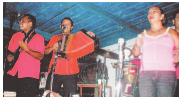
LEGADO. La cantante y salomadora ingresó al conjunto en 1997.