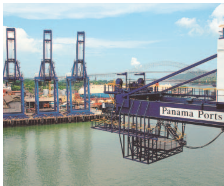
ALTURA. La barcaza Dockwise, que trajo las grúas de Corea, esperó ayer marea baja para no rozar el Puente de Las Américas.

Aunque el Gobierno, propietario del 10% de las acciones de