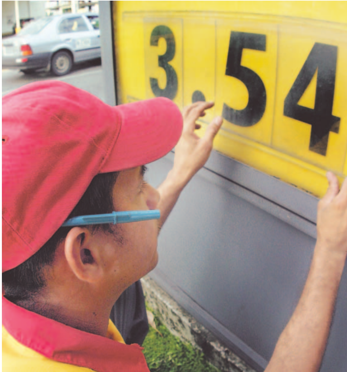
NUEVA ALZA. El combustible gatilló un encarecimiento de bienes y servicios en mayo.

La fuerte expansión económica también ha sido acompañada por un aumento general en los precios de bienes y servicios. En mayo el Índice de Precios al Consumidor subió 3.1% en comparación con el año pasado, con alzas en el costo del transporte (14.1%), vivienda (7.5%), muebles (2%), alimentos (0.9%) y salud (0.2%), según la Contraloría