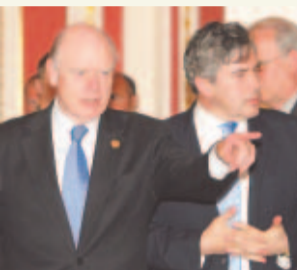
PASE A LA 63A