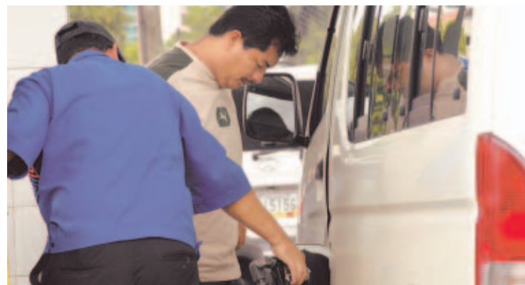
COSTOSO. Este jueves habrá nuevos cambios en los precios de referencia de los combustibles.