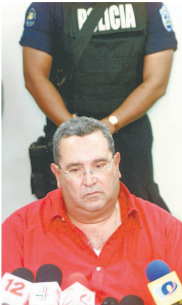
PROCESADO. Las autoridades manejan un caso que involucra al ex presidente de Nicaragua Arnoldo Alemán.

Además, el 40% de estos encuestados considera que los bancos establecidos en Pana-