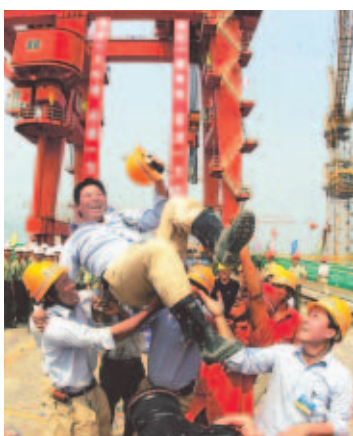
Los constructores celebran la culminación del proyecto.

Tras 12 años de trabajo, la obra finalizó 10 meses antes, y la hidroeléctrica empezará a funcionar en 2008.