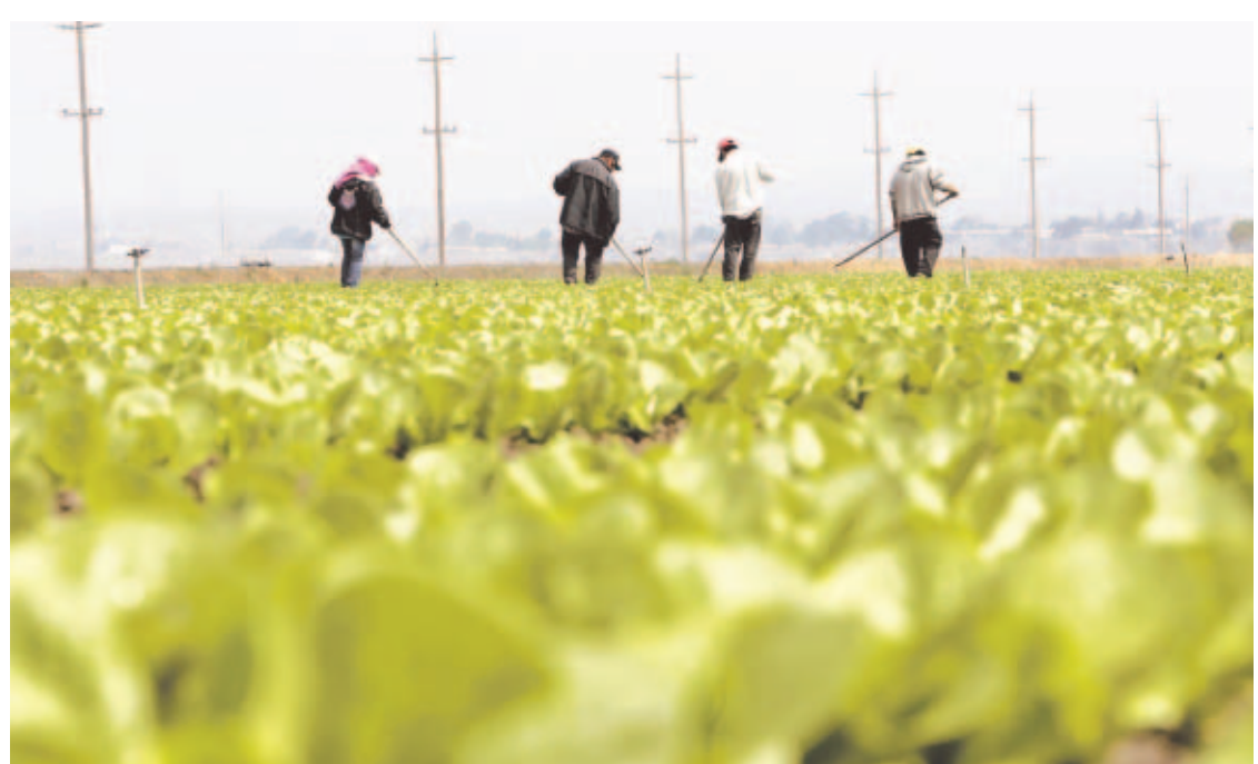
LAS LECHUGAS DE SALINAS. Muchos de los indocumentados atienden los campos en los estados agrícolas de la Unión Americana, como en este campo de lechugas en Salinas, California.

■ La movilización puede paralizar ciudades como Los Ángeles, Chicago, Nueva York o Tucson. ■ La jornada de protesta profundizó los desacuerdos sobre las tácticas de presión ante el Legislativo.