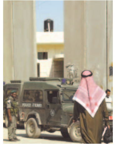
Barrera de separación.

La decisión de continuar con la construcción del muro "fue aprobada con el objetivo de prevenir ataques terroristas", y