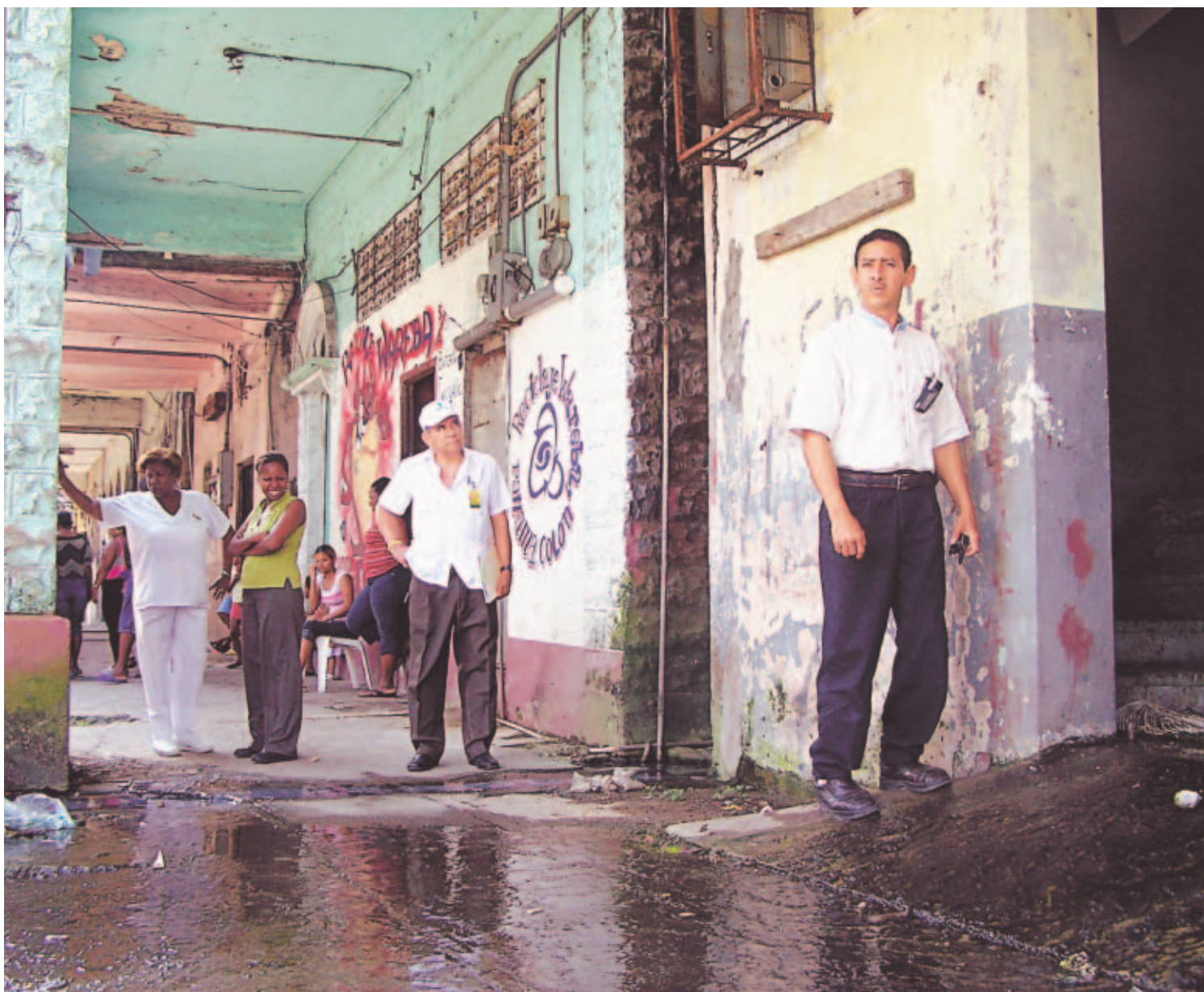
PROMESA. Las autoridades aseguran que las aguas negras en las calles serán cosa del pasado.

COSTO. LA OBRA ESTÁ VALORADA EN 8 MILLONES 700 MIL 273 DÓLARES.