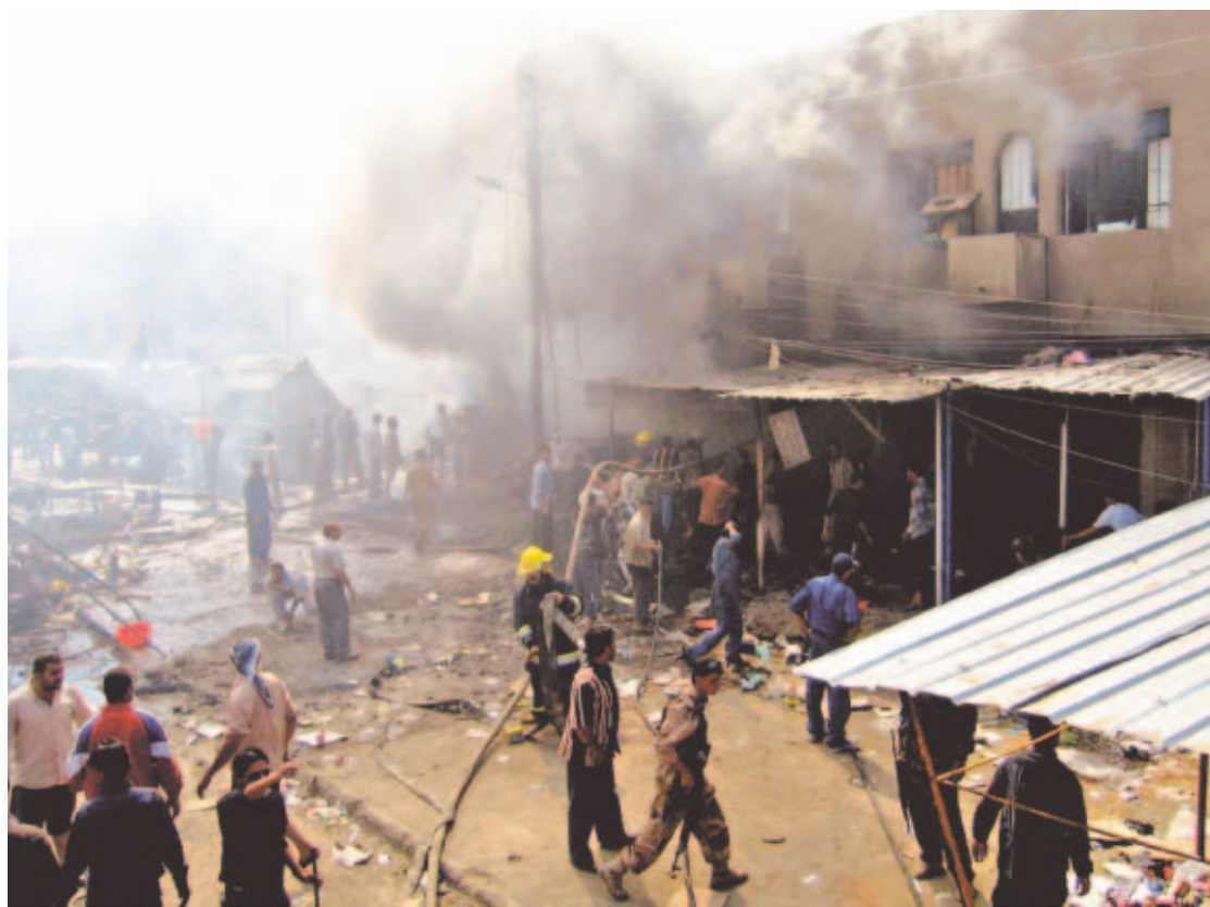
ATAQUE. La explosión de un coche bomba en un mercado cerca de una mezquita chií en Bagdad dejó seis muertos.

Straw dijo que Kember, un ex profesor de medicina, está en la Embajada del Reino Unido