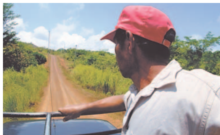
PREOCUPACIÓN. Los moradores temen que con la llegada del invierno se pierda la inversión que supera los 500 mil dólares.