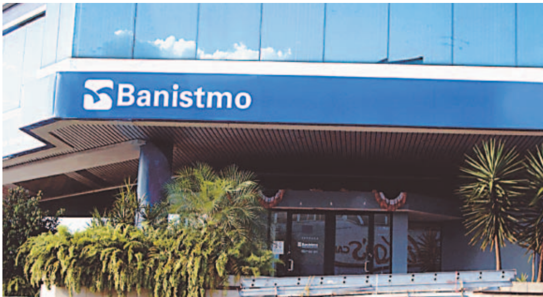
JUEGO DE FRANQUICIAS. Desde diciembre del año pasado corren rumores del interés de consorcios globales por Grupo Banistmo.

Según los estados financieros más recientes de Banistmo al 30 de septiembre de 2005 en la