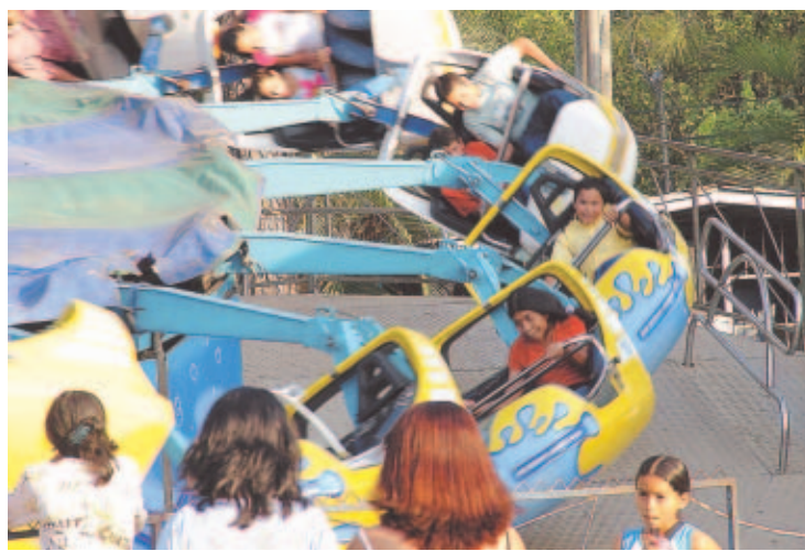
ATRACCIONES. Los jóvenes podrán disfrutar de las tarimas artísticas y los juegos mecánicos.