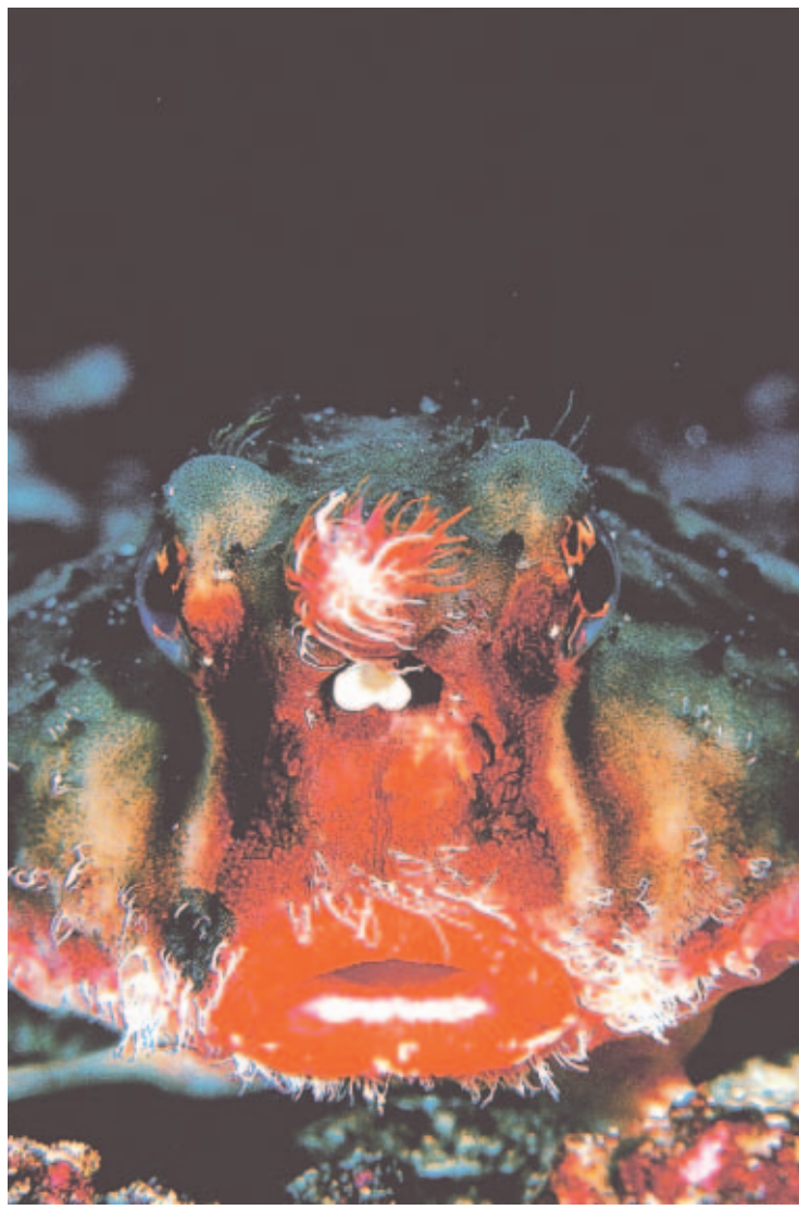
VIDA. Los habitantes del mar se recuperan tras la partida de los pescadores comerciales.

buscando peces limpiadores, como el pez mariposa y el pez ángel rey, que eliminan sus parásitos, hongos y otros organismos polizones.