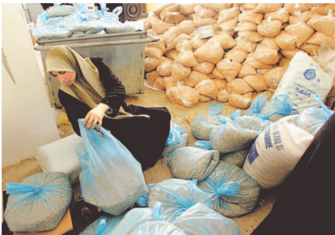
ASISTENCIA. El Programa Mundial de Alimentos trabaja arduamente en los territorios repartiendo comida. Los palestinos están en ascuas sobre qué pasará al asumir Hamas.