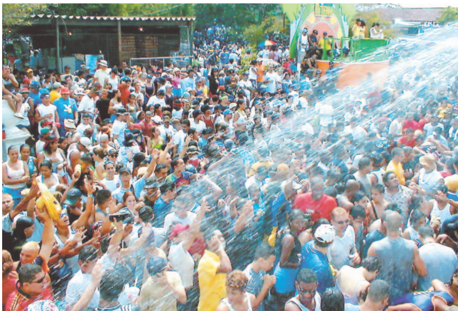
CULECOS. Tal como lo revela la encuesta, el distrito de Las Tablas, en la provincia de Los Santos, es el punto más caliente del Carnaval panameño.