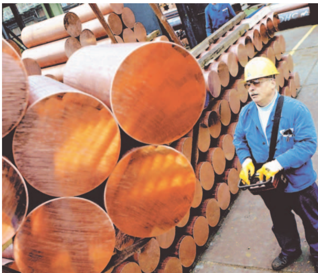
MERCADO. La demanda de los metales preciosos ha tenido un fuerte incremento en el último año.

Los proyectos que están más pronto a reiniciar operaciones son Petaquilla Minerals Ltd.,