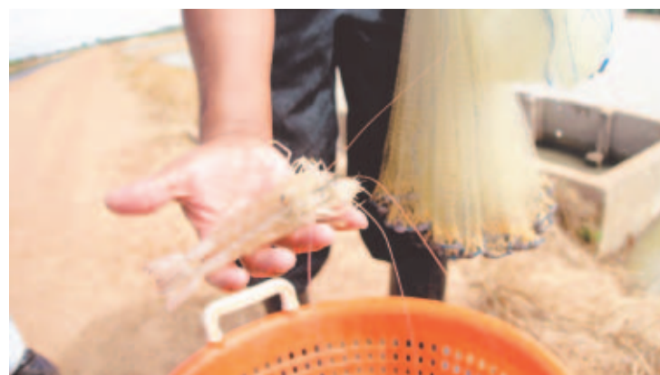
CALIDAD EXPORTABLE. Esperan incentivar el cultivo de camarón.