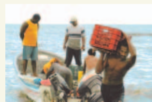
PASE A LA 30A