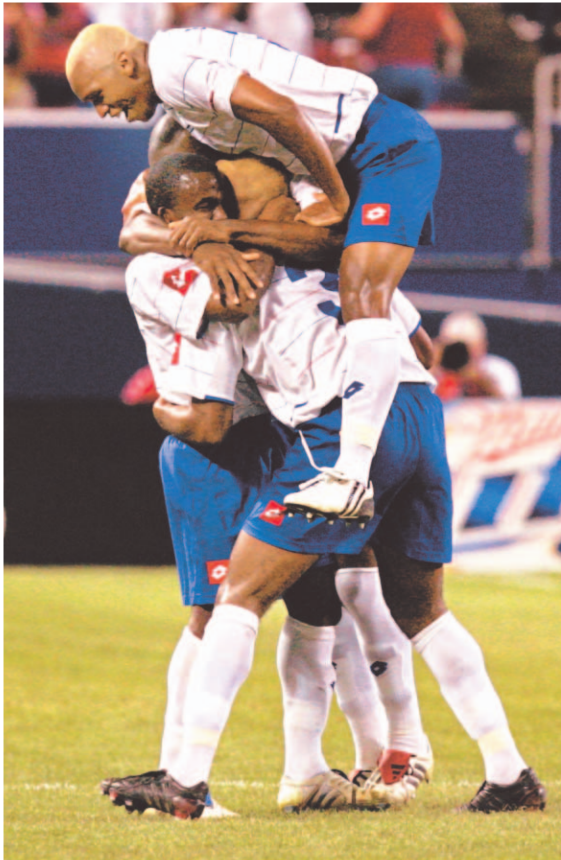
CONSUELO. La Copa de Oro fue un triunfo efímero que se terminó con la eliminación al Mundial de Alemania.

Ghana ganó la carrera como el equipo de mayor progreso.