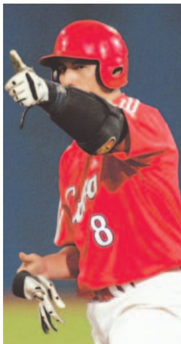
Cuba es la manzana de la discordia.

La oficina del comisionado de Grandes Ligas y la asociación de peloteros profesionales han dicho que aclararán las dudas del Gobierno y garantizarán que no habrá transferencias de dinero de entidades estadou-