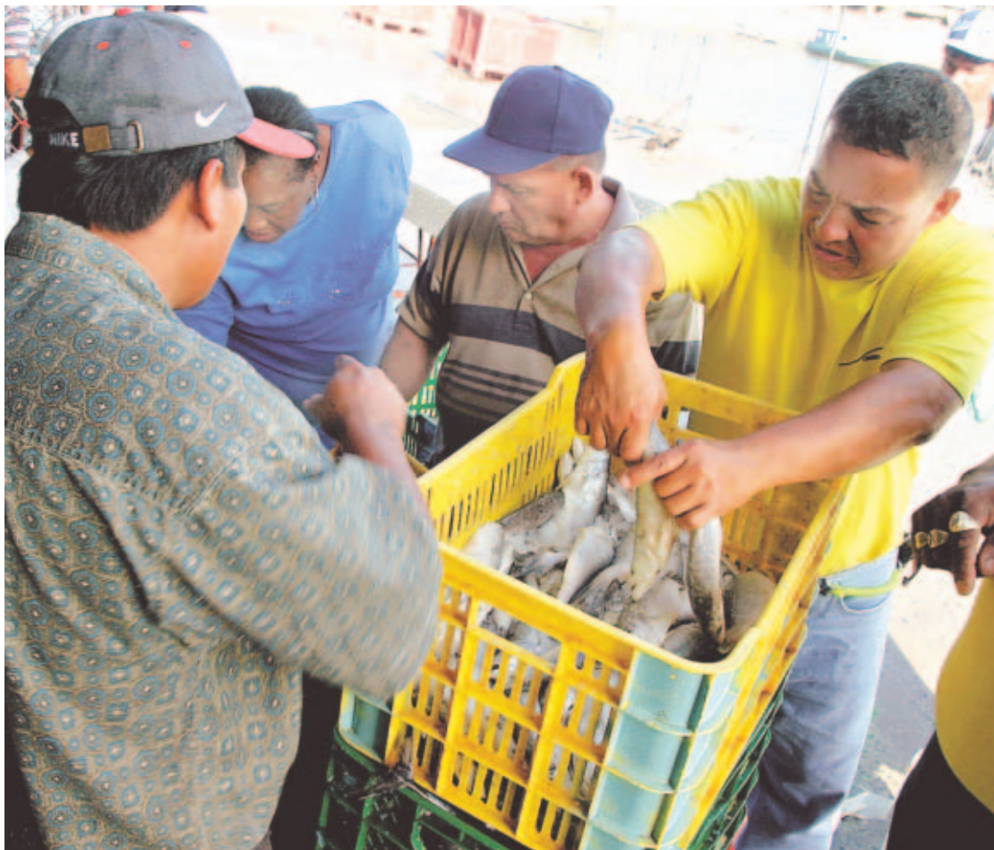
COMPETENCIA DESLEAL. Cada camión tico sale de Panamá con un estimado de 14 mil libras de productos del mar.

Pero últimamente, un caso relacionado a la pesca está