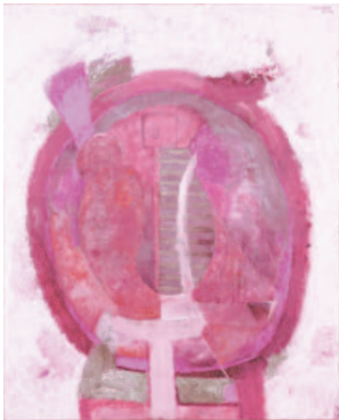
MÉXICO. Rufino Tamayo, óleo sobre tela

En el aniversario de su nacimiento Hong Kong y Bosnia develaron monumentos en honor del actor. I2B