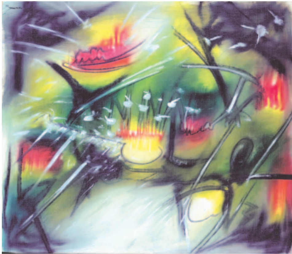
CHILE. Roberto Matta, sin título, óleo sobre tela.