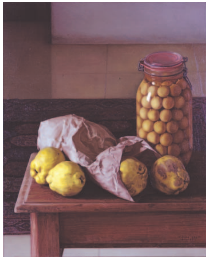
CHILE. Claudio Bravo, óleo sobre tela, 1984 (bodegón).