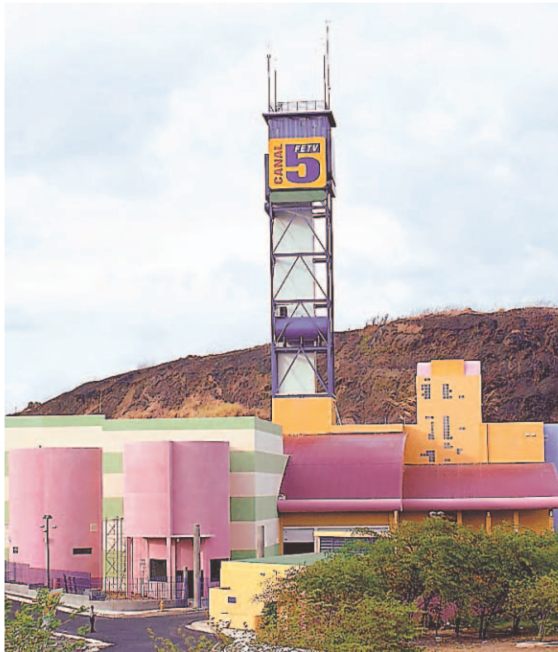
LA BUENA TELEVISIÓN. El moderno edificio que alberga las instalaciones de Canal 5 costó más de 4.5 millones de dólares.