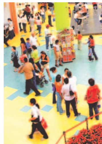
Un pasillo de Albrook Mall.

En el centro comercial Los Andes se va a reforzar la segu-