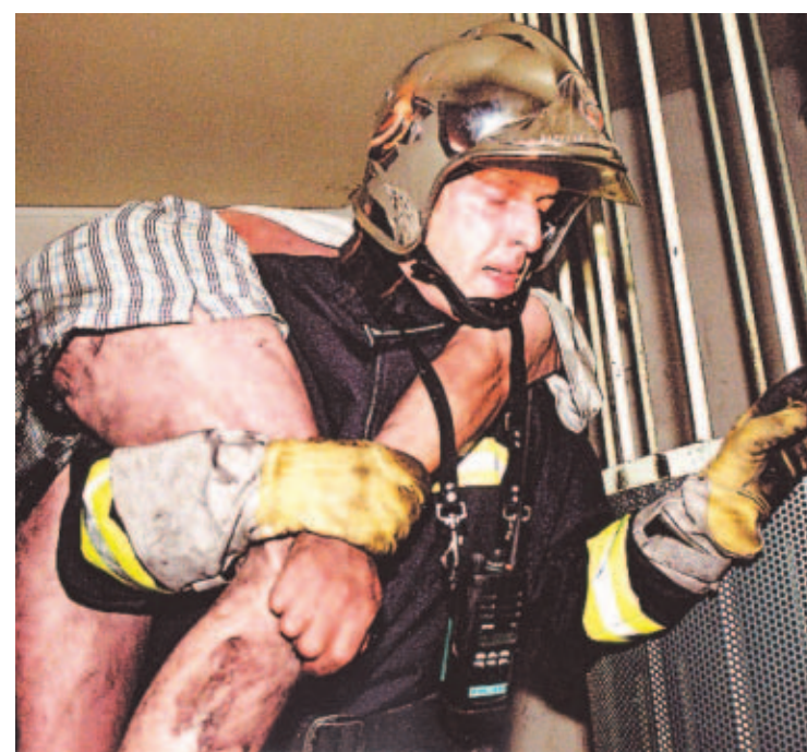
RESCATE. Los bomberos evacuaron con vida a unas 30 personas, entre ellas una mujer embarazada que dio a luz.

De acuerdo con los investigadores, este siniestro en una de las torres de L'Hay les Roses no guarda relación con los dos anteriores.