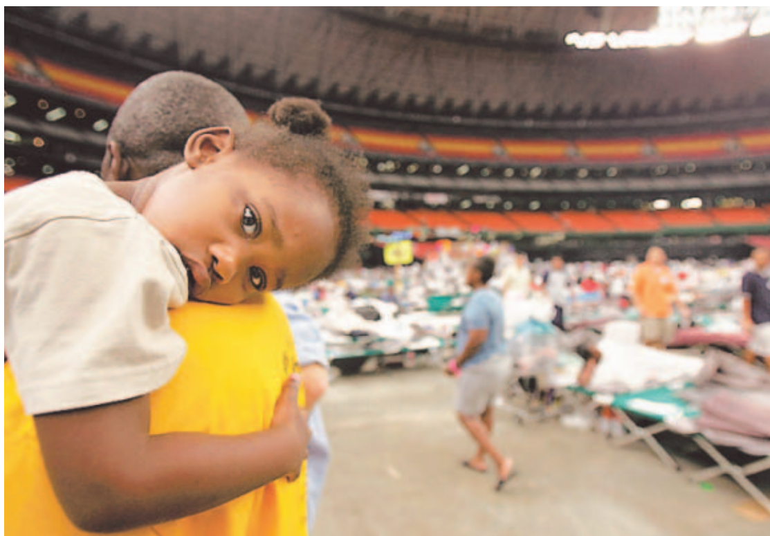
DESALOJO. Unas 16 mil personas reciben refugio en el Astrodome de Houston, Texas.

PESADILLA. MUCHOS MURIERON ATRAPADOS EN SUS CASAS.