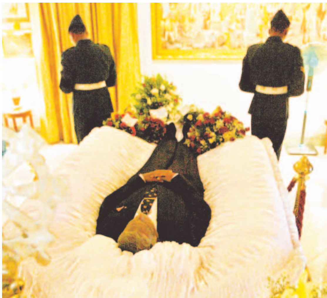
PACIFICADOR. El canciller Kadirgamar era un tamil opuesto a las acciones de la guerrilla separatista.