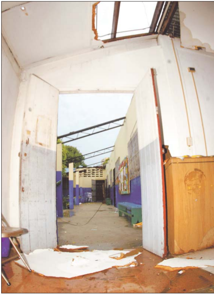
A su paso, el vendaval derribó el techo de la escuela República de Finlandia, en San Sebastián, San Francisco.

Los techos de tres viviendas resultaron afectados en