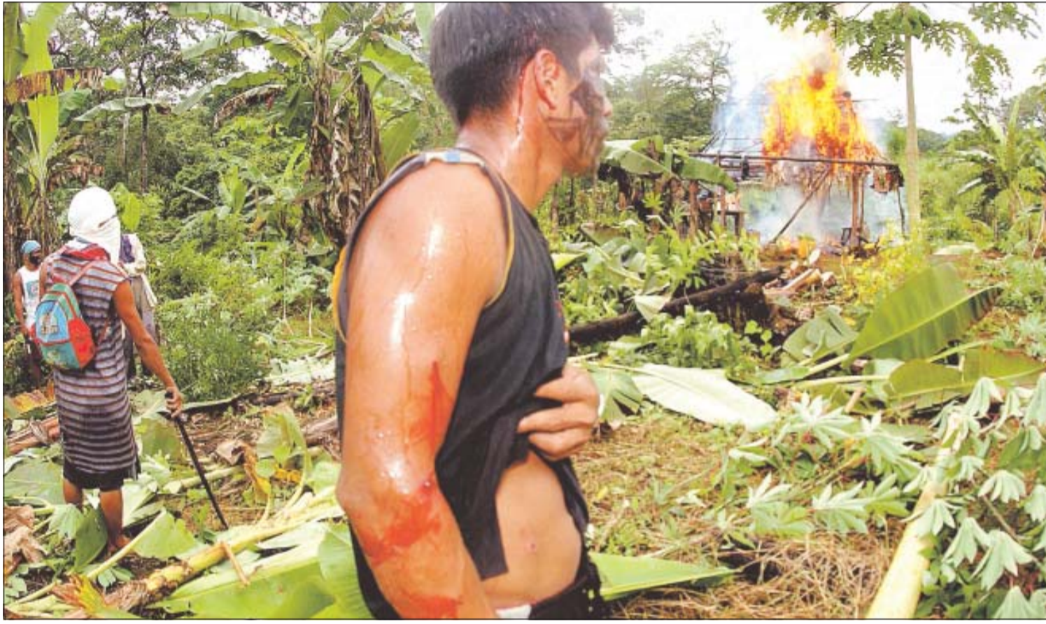
Un indígena herido observa cómo arde el rancho de uno de los colonos.

Se desconoce el destino de tres santeños, dos de ellos heridos de gravedad