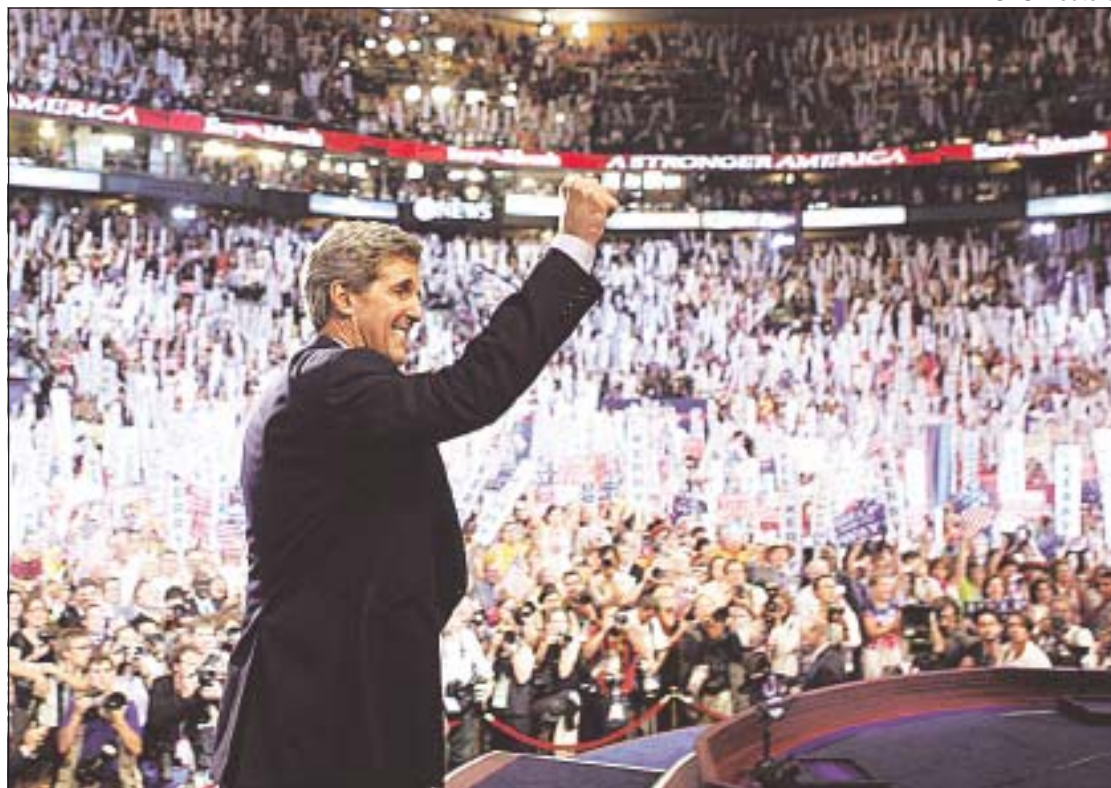
El candidato presidencial John Kerry saluda a sus seguidores, luego de su discurso en la Convención Demócrata ayer, en Boston.

Cleland, quien perdió las dos piernas y el brazo derecho en Vietnam en abril de