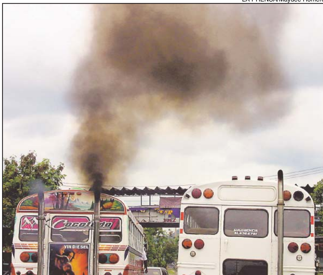
El contenido de azufre en el diesel que se vende en Panamá es muy alto para introducir dispositivos de control en los vehículos, según un experto en la materia.

Un estudio de Celedonio Moncayo, experto en contaminación y miembro de la Sociedad Panameña de Ingenieros y Arquitectos (SPIA), llama la atención a las autoridades sobre la contaminación que producen los vehículos diesel, y recomienda crear una estrategia que enfrente el congestiona-