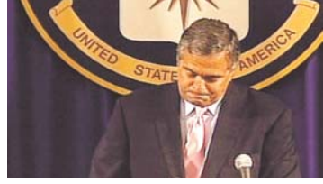
Momento para el cambio