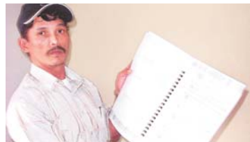
Interponen demanda millonaria contra Morris