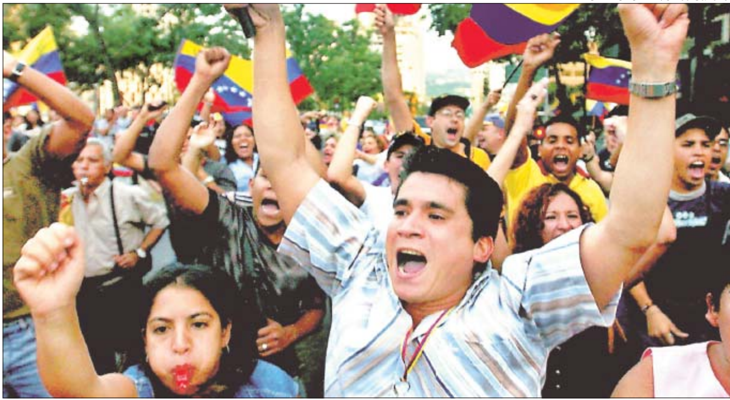
Opositores del presidente venezolano, Hugo Chávez, celebran el anuncio de que se alcanzó el número de firmas requeridas para solicitar el referéndum presidencial.

"El árbitro ha emitido unas cifras preliminares con una clara tendencia, difícil que se revierta", dijo el presidente, quien insistió en que la palabra del Poder Electoral es sagrada, por lo que "es