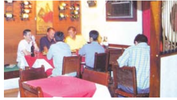
El 'trip' después de los 30