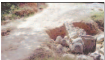
Los olvidados de Membrillo 8A