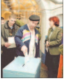
Reeligen a Putin