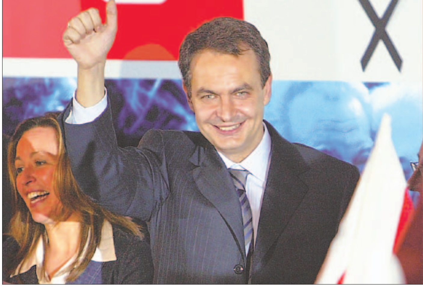
Un eufórico José Luis Rodríguez Zapatero saluda a sus seguidores, tras conocer el triunfo sobre la derecha española, aglutinada en el Partido Popular.

llamaban "presidente, presidente" en la sede de su partido, Rodríguez Zapatero inició su intervención recordando a las víctimas de los atentados de Madrid, para las que pidió un minuto de silencio, que cumplieron todos los presentes.