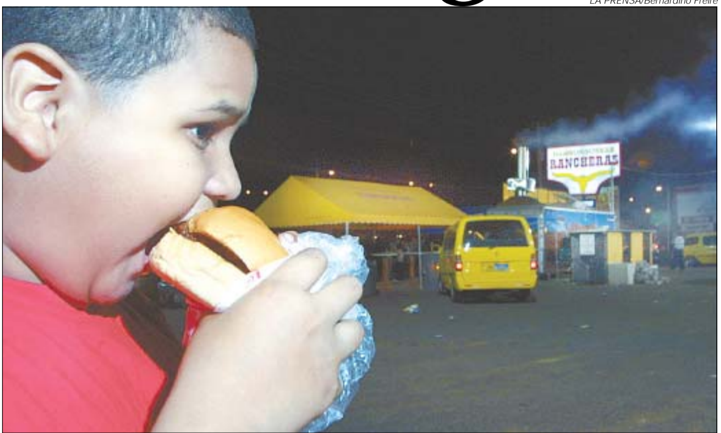
Las Hamburguesas Rancheras han causado una revolución en la capital. Y nadie parece discutir ni su precio ni su sabor. Incluso, ya no hay hora fija para comerlas. Las filas de gente que compra el “dúo” son notables en cada uno de estos puestos de venta.

“Hamburguesas Rancheras” —la novedosa cadena de venta ambulante de comida rápida— parece haber cautivado a miles de comensales que, sin importar la hora, la lluvia o el más intenso calor, se agolpan en largas filas para comprar su flamante “dúo” —hamburguesa y soda—, que virtualmente ha puesto en aprietos los que hasta ahora eran los intocables “tríos” —hamburguesas, soda y papas fritas— y cuyos precios sobrepasan con frecuencia hasta tres veces el precio del “dúo”.