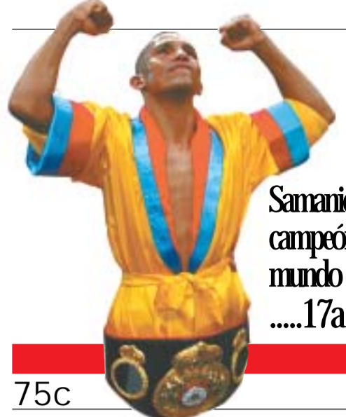
Samaniego, campeón del mundo .....17a