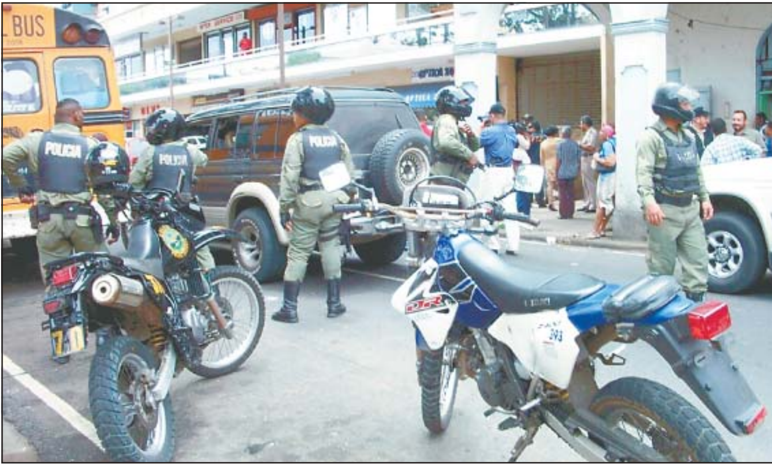
Ayer la Policía Nacional realizó un intenso operativo en la ciudad de Colón para capturar a otros involucrados en el asesinato del jefe aduanero de Colón. (Foto inferior) La policía detuvo a varias personas para investigar su vinculación.