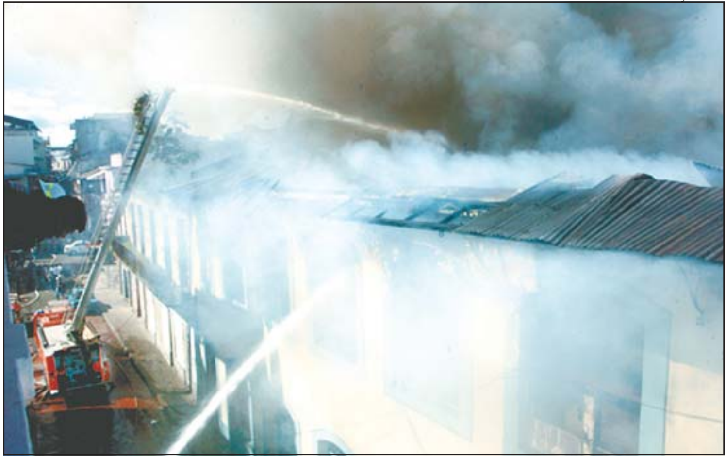
Se requirió el concurso de un centenar de bomberos para controlar este incendio que dejó en el desamparo a unas 30 familias, cuya reubicación es incierta.

José Quintero De León jqintero@prensa.com