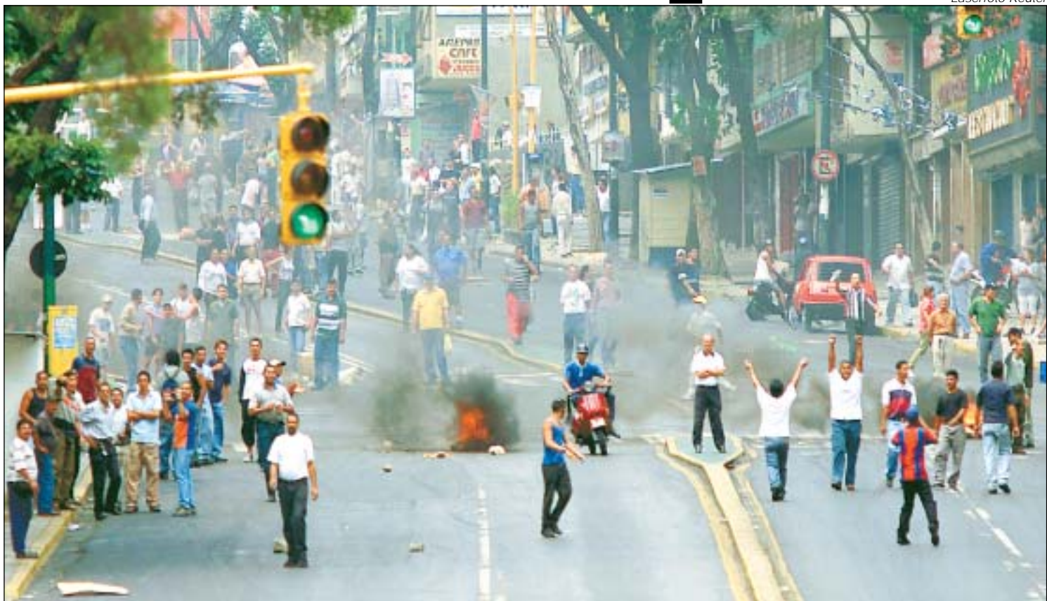
Nueve muertos dejaron los incidentes ocurridos ayer en la capital venezolana.

Cabello asumió la presidencia tras la dimisión anoche de Pedro Carmona, quien ocupaba el cargo desde el golpe de Estado de la víspera