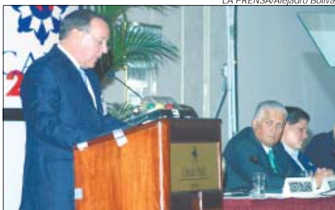
Ernesto Pérez Balladares observa a Alberto Vallarino, que da su opinión sobre la economía panameña.

"Al examinar el panorama de nuestra nación no encuentro ni las políticas adecuadas, ni las bases para generar la confianza en nuestras instituciones", señaló Pérez Balladares.