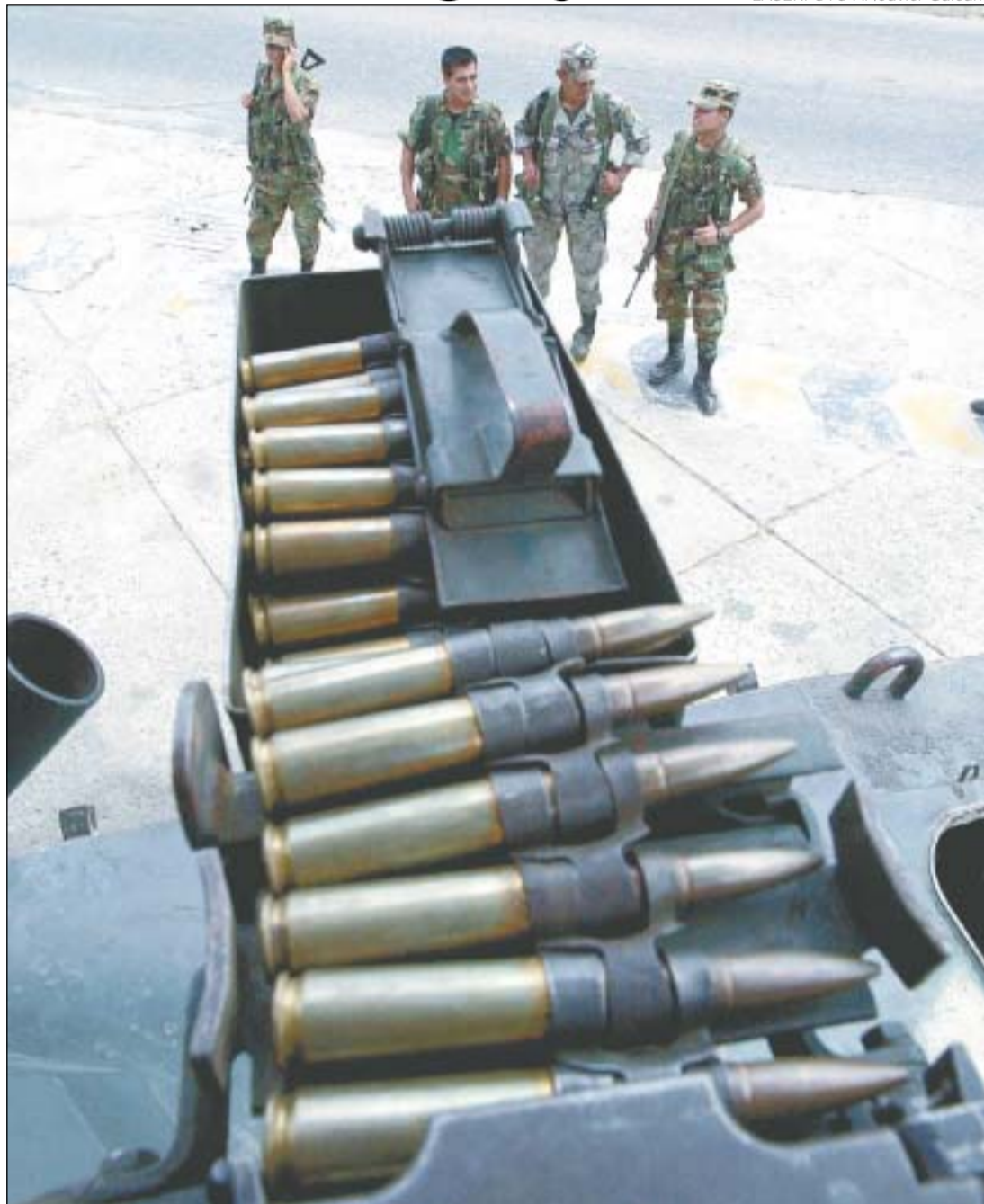
A solo 120 millas de Bogotá, soldados colombianos preparan una caravana de tanques al este de lo que hasta hace unos días fue una zona ocupada por la guerrilla.