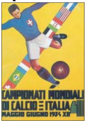
Italia 1934 17A