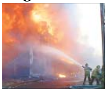
La Boca Town en llamas 12A