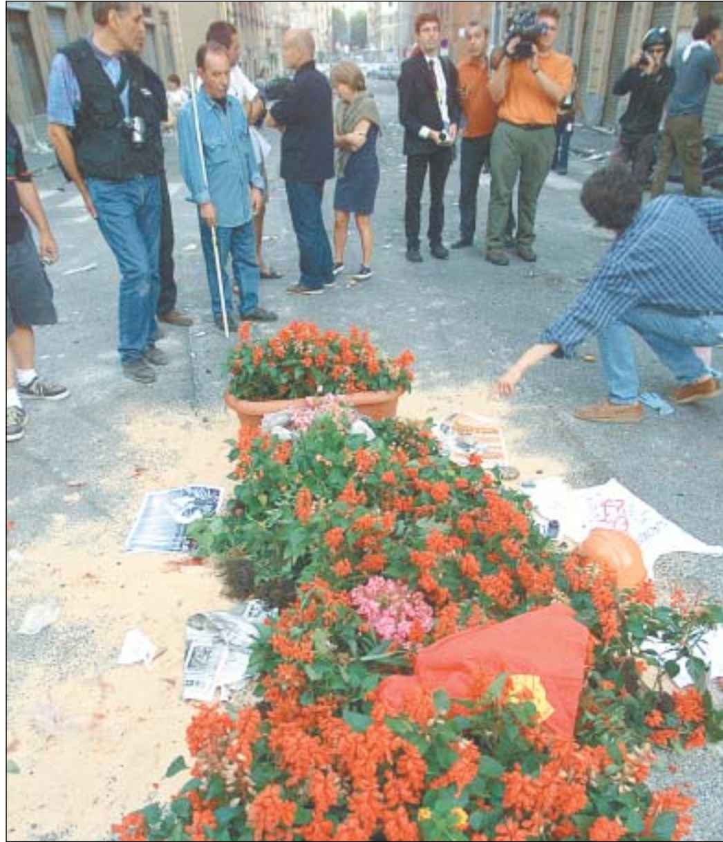
Manifestantes se detienen en el lugar cubierto de flores, donde uno murió en los enfrentamientos con la Policía.

GENOVA, Italia (ANSA). —Un italiano de 23 años murió ayer al ser baleado por un carabiniere y se convirtió en la primera víctima fatal del movimiento de protesta antiglobalización, durante los choques entre la policía italiana y manifestantes, en la Cumbre del G-8 en Génova, donde además 185 personas resultaron heridas y un centenar detenidas.