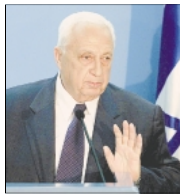
Sharon propone a los palestinos un alto el fuego 21A